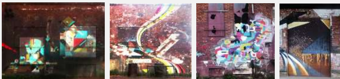
FASADBILDER PÅ DEN FÖRFALLNA GÅRDSBYGGNADEN

Rapporten resulterade i möten med bland andra Serneke AB, Business Region Gbg och SBK. Löfte gavs om nyttjande av lokaler inom Karlstaden samt deltagande i Kommunens STUP-möten för Lindholmens utveckling. HASSP-gruppen har blivit väl förtrogen med Lindholmen.