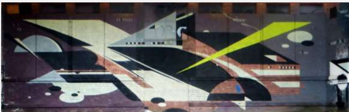
FASADBILDER PÅ DEN FÖRFALLNA GÅRDSBYGGNADEN