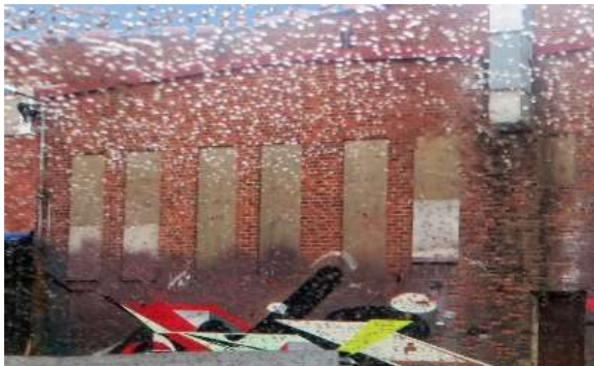
DEN FÖRFALLNA GÅRDSBYGGNADEN BLIR OBEYA UNDER FRAMTIDSVECKAN

Har ni synpunkter eller vill ni bli delaktiga?