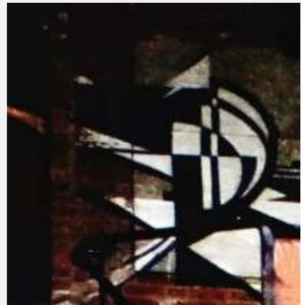
DEN FÖRFALLNA GÅRDSBYGGNADEN OCH FASADBILDER