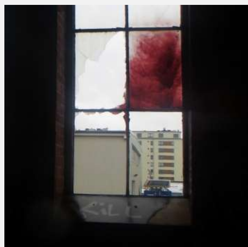
IDÈ: HASSP SOM CONFLUENCE DIT ALLT KAN HASSPAS OCH I SAMVERKAN NÅ MÅLEN